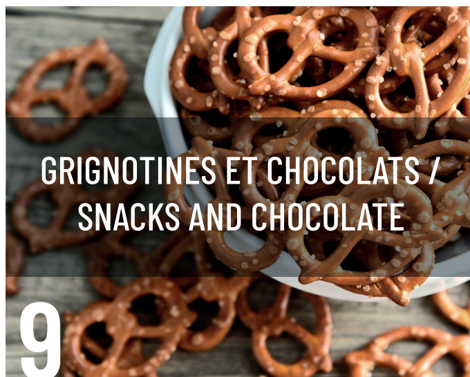
GRIGNOTINES ET CHOCOLATS / SNACKS AND CHOCOLATE