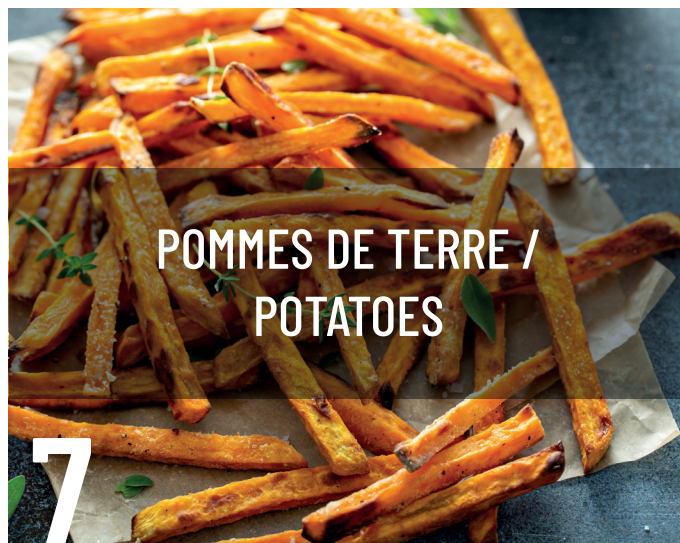
POMMES DE TERRE / POTATOES