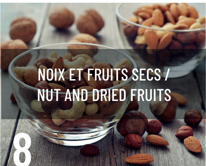
NOIX ET FRUITS SECS / NUT AND DRIED FRUITS