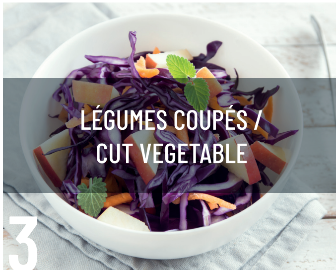
LÉGUMES COUPÉS / CUT VEGETABLE