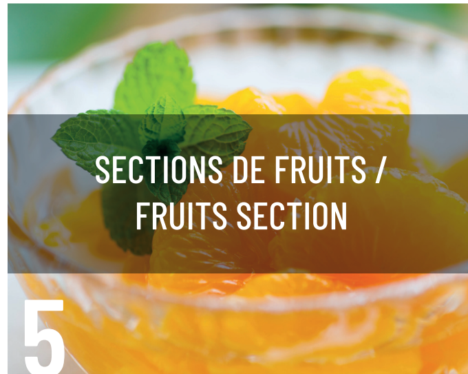
SECTIONS DE FRUITS / FRUITS SECTION