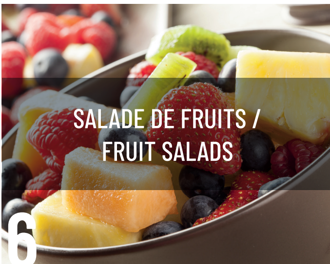
SALADE DE FRUITS / FRUIT SALADS